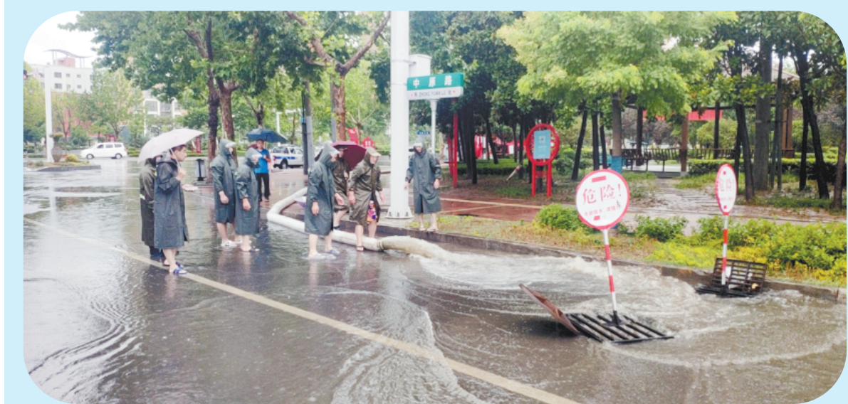
6月27日,我市普降暴雨,中心城区多处路段积水。交警、城管人员、社区工作人员或坚守岗位指挥交通,或冒雨抽排积水,或下手清理雨水篦子,最大程度减少积水对市民出行的影响。他们在暴雨中坚守的身影,成为了一道充满温情的美丽风景。