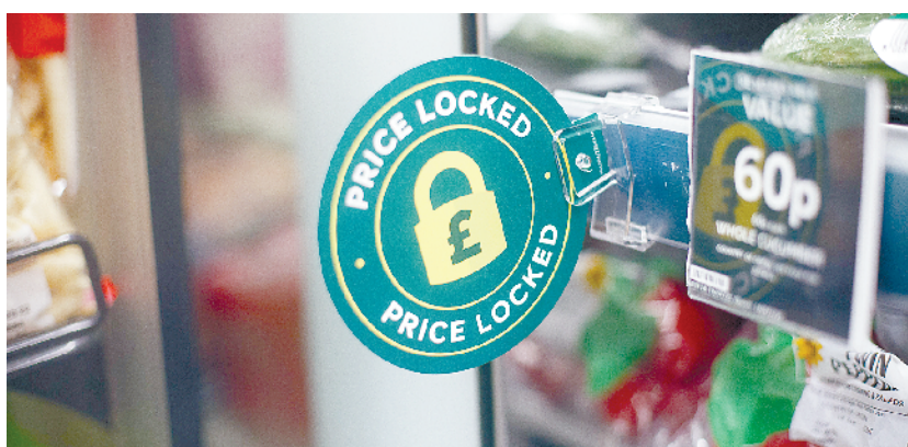
英国7月CPI同比涨幅再创40年来新高

8月22日,人们在俄罗斯莫斯科排队等待进入一家“星咖啡”门店。近日,星巴克的接替者“星咖啡”连锁店在莫斯科开业,受到人们欢迎。