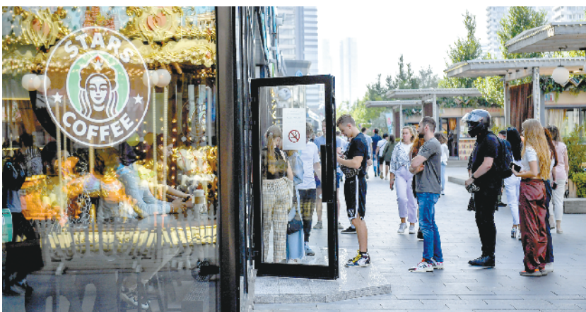
告别星巴克 俄罗斯迎来“星咖啡”

疗等问题。报道说,目前美国约有3000万人没有医保,如何让这些人能够接种新冠疫苗和获得治疗,是政府面临的严峻挑战。