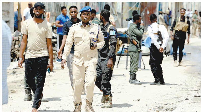
新华社内罗毕8月21日电

索马里卫生部21日发表声明,证实19日晚在索首都摩加迪沙一家酒店发生的恐怖袭击已造成21人死亡、117人受伤。