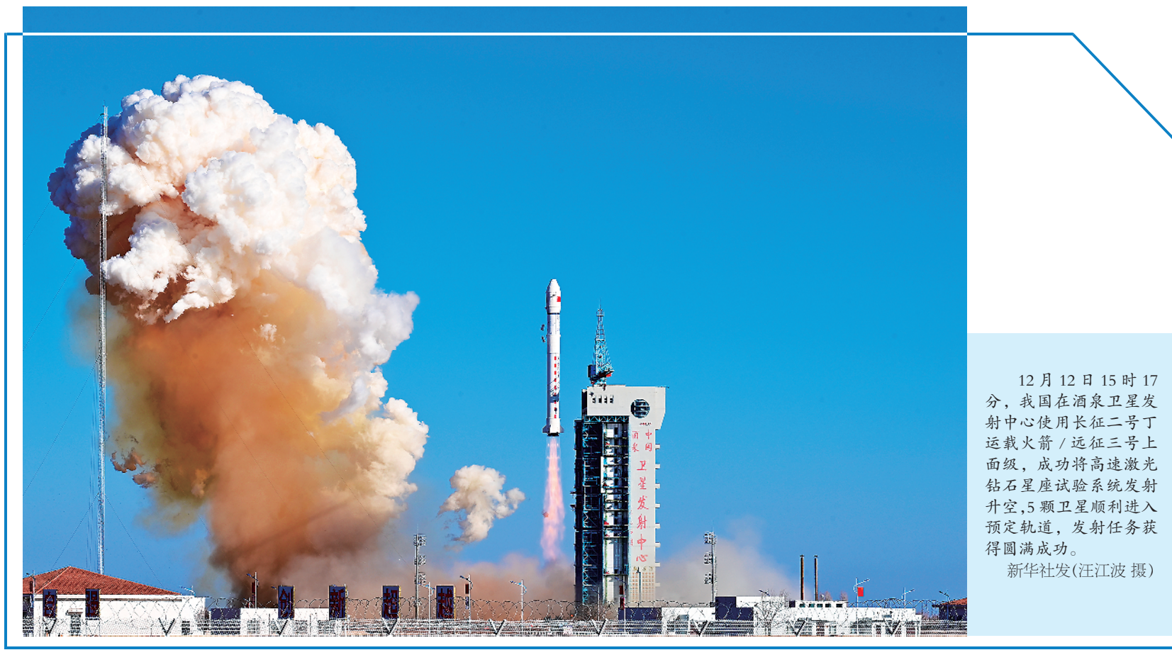
12月12日15时17分,我国在酒泉卫星发射中心使用长征二号丁运载火箭/远征三号上面级,成功将高速激光钻石星座试验系统发射升空,5颗卫星顺利进入预定轨道,发射任务获得圆满成功。