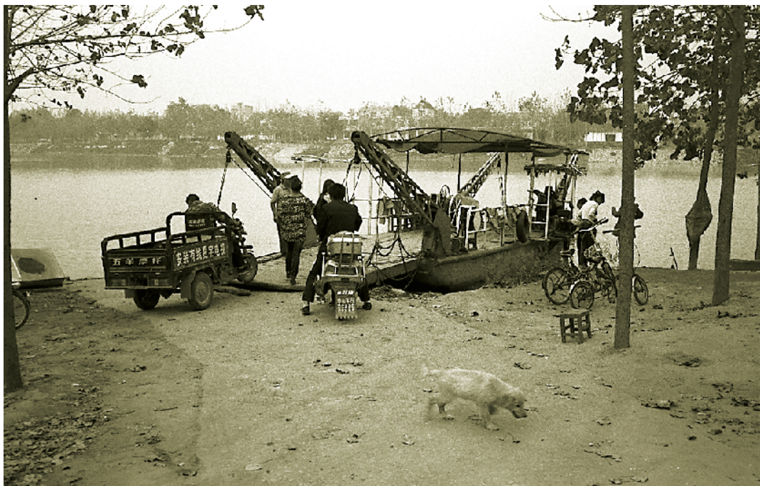
2008年的淮阳新站渡口。

沙颍河碧水东流。现在的渡口船在上世纪八九十年代就由木船换成了钢筋铁骨，早已由国营改成了个体承包经营，就连汽车也登上了渡船，渡口票更不是几十年前的“叁角”“贰角”了。我留存的这两张渡口票，不过是方寸间的小小纸片，乘着时代的大船，恰是“君看渡口淘沙处，渡却人间多少人”。